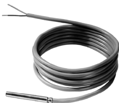
QAZ21... и QAZ36...